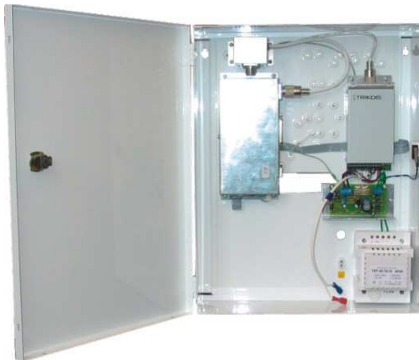
Рис.1.Общий вид ретранслятора RR-VHF / RR-UHF

Ретранслятор устанавливается в закрытых помещениях. К нему подключается питание сети переменного тока и внешняя антенна.